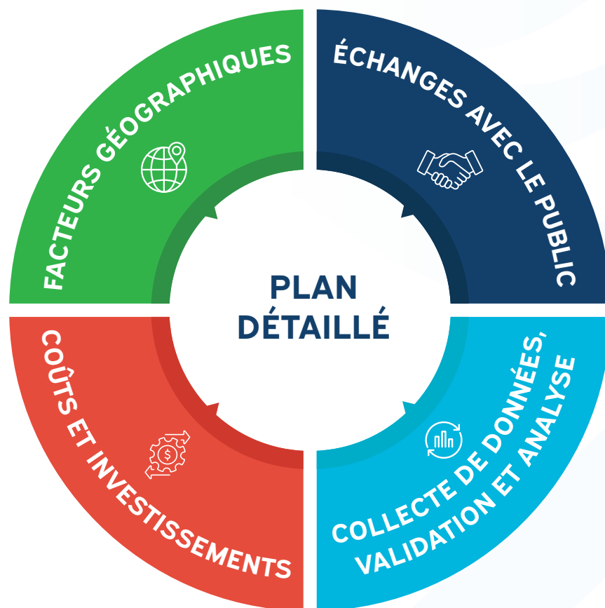
Figure 1 : Développement du plan détaillé

Le parc immobilier d'Habitation TNO, qui compte plus de 2 700 logements, est réparti dans cinq régions et 32 collectivités des TNO. La Stratégie et le Plan détaillé ont été élaborés en fonction de facteurs géographiques, d'une évaluation approfondie de la consommation d'énergie et des émissions de l'ensemble du parc immobilier, d'une série d'échanges avec le public et d'une évaluation technique des mesures et des initiatives susceptibles d'être mises en œuvre et de leurs coûts éventuels. Ce processus nous a permis de respecter les priorités énergétiques et les capacités techniques de nos collectivités, de nos partenaires et de nos intervenants, tout en orientant nos actions et nos initiatives pour qu'elles aient la plus grande incidence possible, et ce, au meilleur coût qui soit.